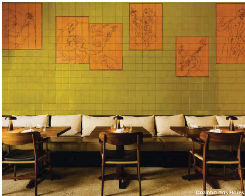
Cozinha das Flores